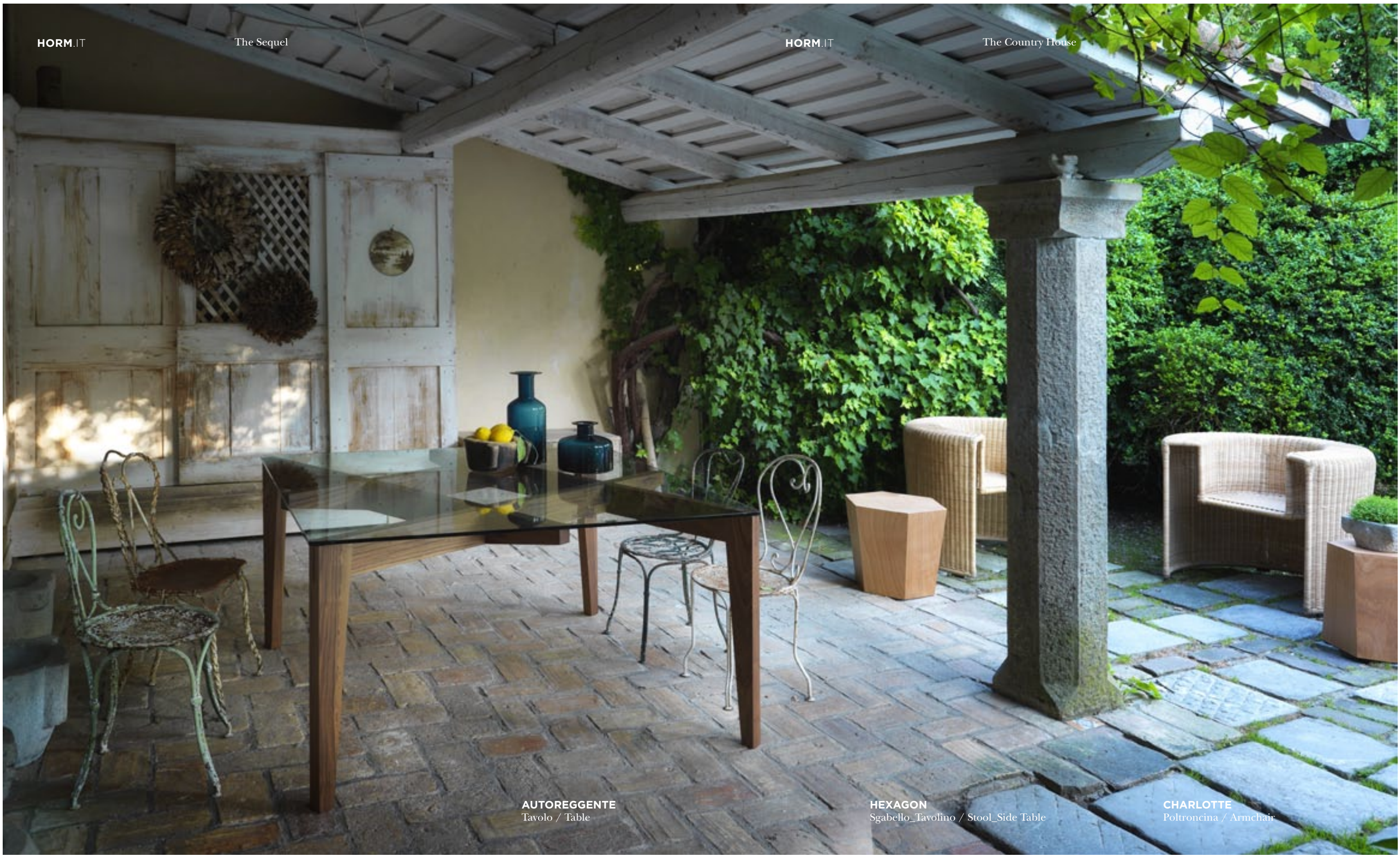
AUTOREGGENTE Tavolo / Table