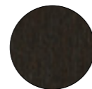
faggio tinto moca mocha beech