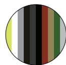
ripiani e schiene shelves and back panels tutti i laccati Horm all Horm lacquers