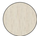
faggio imbiancato whitened beech